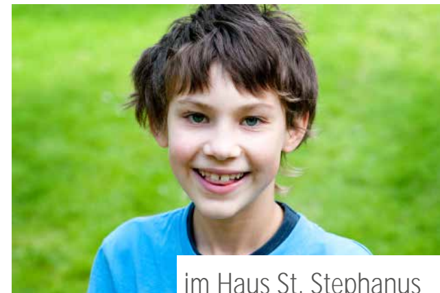
im Haus St. Stephanus