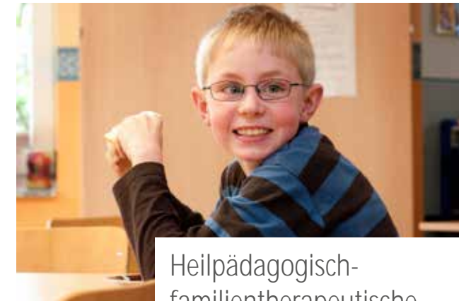
Heilpädagogisch-familiientherapeutische Intensivgruppe für Kinder