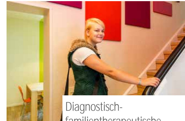
Diagnostisch- familietherapeutische Wohngruppe für Jugendliche